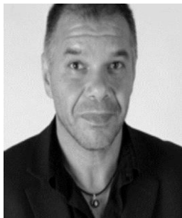
Βασίλης Κ. Φούσκας Καθηγητής διεθνών σχέσεων στο Πανεπιστήμιο του Ανατολικού Λονδίνου και ιδρυτής της ακαδημαϊκής επιθεώρησης Journal of Balkan and Near Eastern Studies